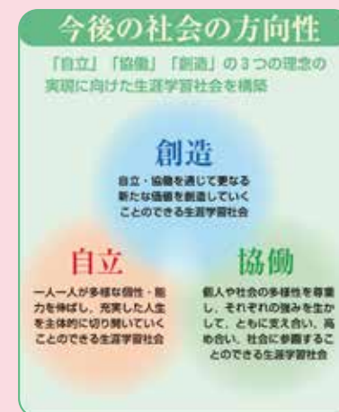
【上図：第2期教育振興基本計画より】

『ときわ未来図』の推進のシナリオは第2期教育振興基本計画と軌を一にするものです。