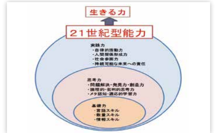
[図：国立教育政策研究所]